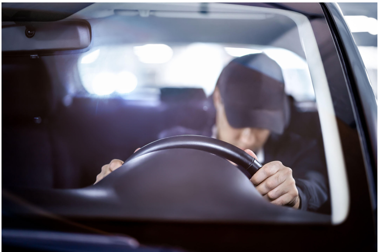
Un automobilista in stato di ebbrezza

Verranno presentati metodi di formazione e addestramento innovativi, permettendo ai partecipanti di provare un ambiente virtuale immersivo, dove sarà ricreato un contesto industriale disseminato di rischi e minacce per la sicurezza. L'esperienza permetterà di comprendere come, molto spesso, all'interno delle aziende possano esserci numerosi rischi che possono essere sottovalutati o addirittura non presi in considerazione. Il tutto all'interno del LEF, il centro di formazione esperienziale di Pordenone.